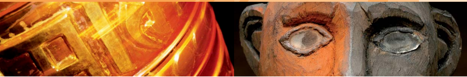
Mani-Gebetszylinder, Nepal